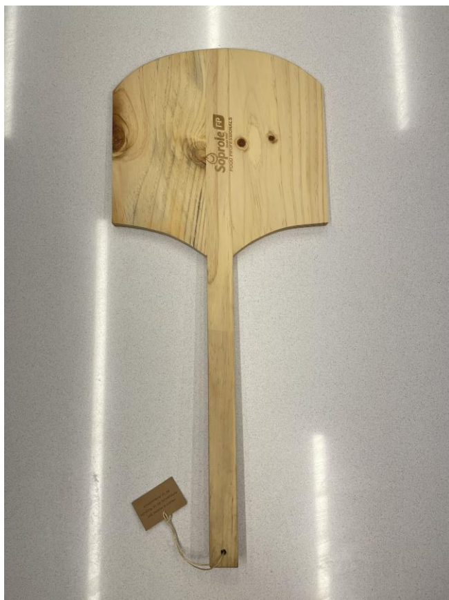
Imagen referencial de la tabla: