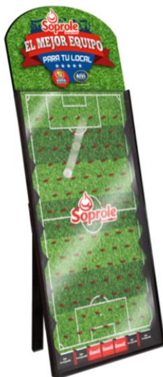
Imagen referencial del tablero:

El material será entregado directamente por el promotor de Soprole luego de que el concursante resulte ganador.